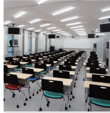
大教室 Lecture Hall (4F・7F) 大教室 대교실