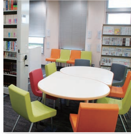
図書室 Library (2F) 圖書室 도서실