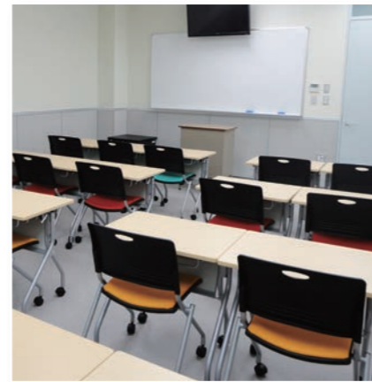
一般教室 Regular Classrooms (4F~7F) 一般教室 일반 교실