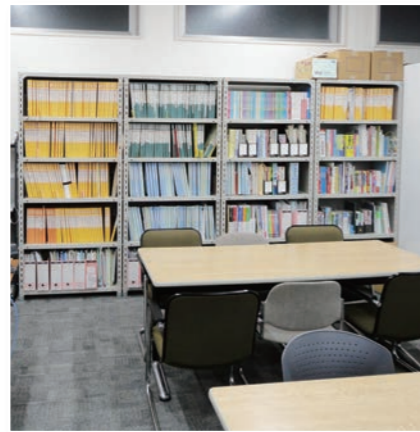
キャリア支援室 Student Support Center (1F) 進路指導室 진로 지도실