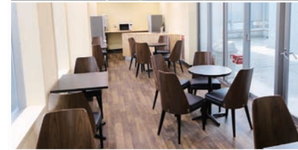
学生ラウンジ Student Lounge (2F・8F) 學生休息室 학생 라운지