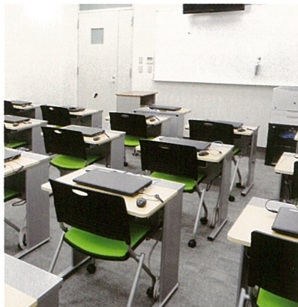
コンピュータ教室／デジタル視聴覚（L.L.C）機能付 Computer Training Room / PC-Language Laboratory 電腦教室／附設有數位視聽（L.L.C）機能 컴퓨터 교실 / 디지털 시청각 (L.L.C) 실로 쓰임