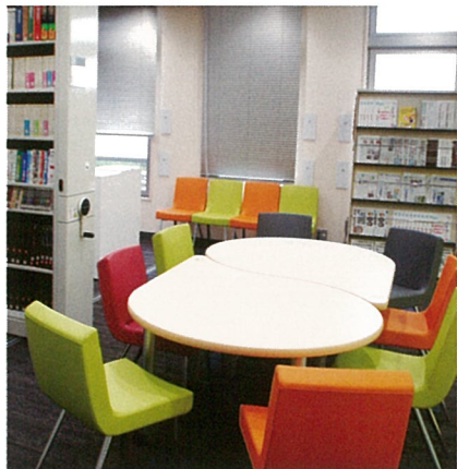
図書室 Library 圖書室 도서실