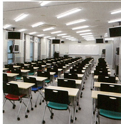
大教室 Lecture Hall 大教室 대교실