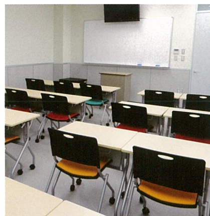
一般教室 Regular Classrooms 一般教室 일반 교실