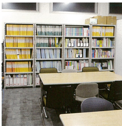
キャリア支援室 Student Support Center 進路指導室 진로 지도실